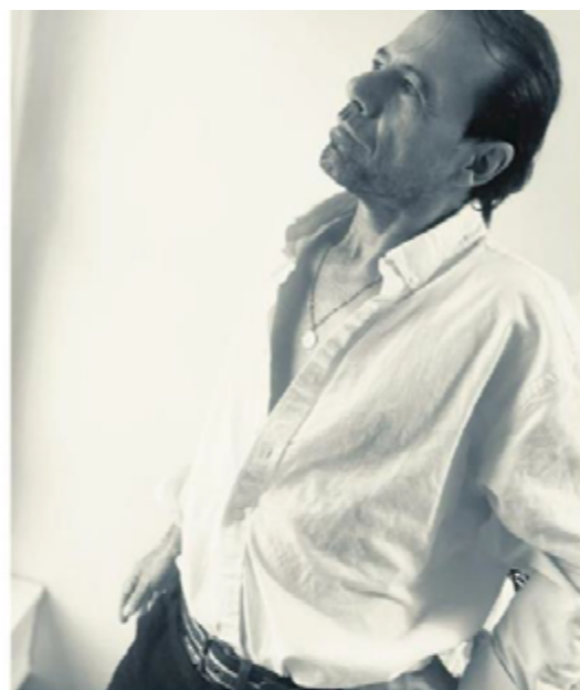
L'artiste est à l'affiche de Heureusement que vous êtes là , de Roland Dubillard, mis en scène par Cécile Tournesol.

Cet acteur n'avait jamais envisagé d'autre métier. À la suite d'un accident de la vie, il renaît au sein du TE'S. La troupe se produira au 4 e festival Imago, dédié aux artistes en situation de handicap.